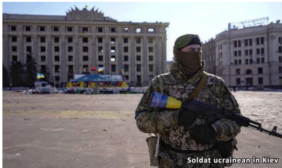
Soldat ucrainean în Kiev

Rusia nu este nici pe departe mulțumită de rezultatele militare obținute în Ucraina în mai bine de o lună de la începutul invaziei sale în Ucraina. „Blitzkrieg-ul” sperat de Moscova în primele zile ale atacului este rezultatul unor calcule extrem de greșite pe care Moscova și le-a