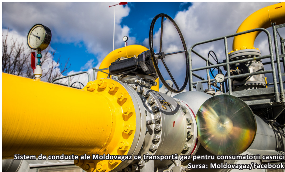
Sistem de conducte ale Moldovagaz ce transportă gaz pentru consumatorii casnici

Republica Moldova se află în fața uneia dintre cele mai dificile de gestionat situații în existența sa ca stat de 31 de ani. Moscova își folosește din nou „arma energetică” asupra Chișinăului pentru a obstrucționa parcursul european al Republicii Moldova.