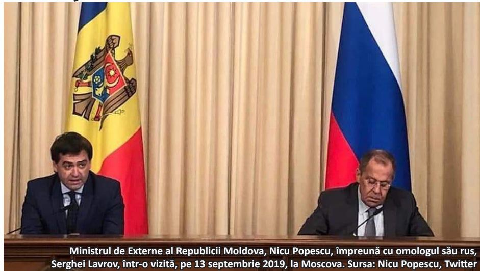
Ministrul de Externe al Republicii Moldova, Nicu Popescu, împreună cu omologul său rus, Serghei Lavrov, într-o vizită, pe 13 septembrie 2019, la Moscova.

Rusia rămâne principala sursă de risc la adresa securității naționale a Republicii Moldova, fapt ce se reflectă și în nivelul tot mai scăzut la nivelul relațiilor diplomatice bilaterale. Moscova și Chișinăul se află în cea mai antagonică perioadă de la destrămarea Uniunii Sovietice în 1991.