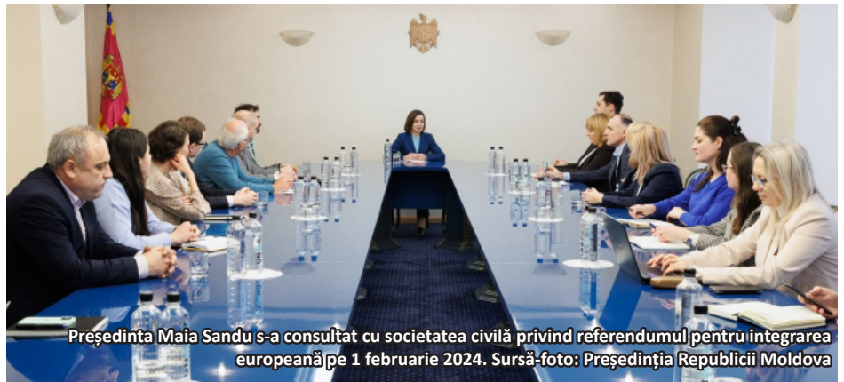
Președinta Maia Sandu s-a consultat cu societatea civilă privind referendumul pentru integrarea europeană pe 1 februarie 2024.

Ideea europeană trebuie promovată de toți vectorii politici sănătoși care cred în această idee împreună cu majoritatea societății din Republica Moldova. Partidul de guvernământ a făcut în ultimii aproape doi ani de zile pași importanți în direcția integrării europene, dar proiectul european trebuie promovat de toți factorii politici pro-europeni, iar pentru acest lucru este nevoie de unitate.